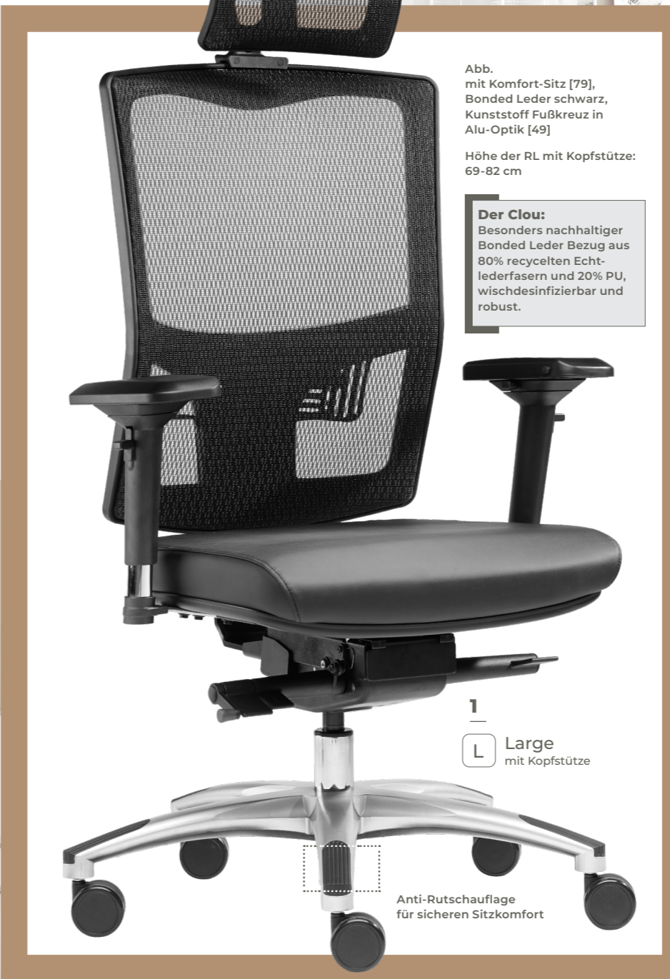
Abb. mit Komfort-Sitz [79], Bonded Leder schwarz, Kunststoff Fußkreuz in Alu-Optik [49]