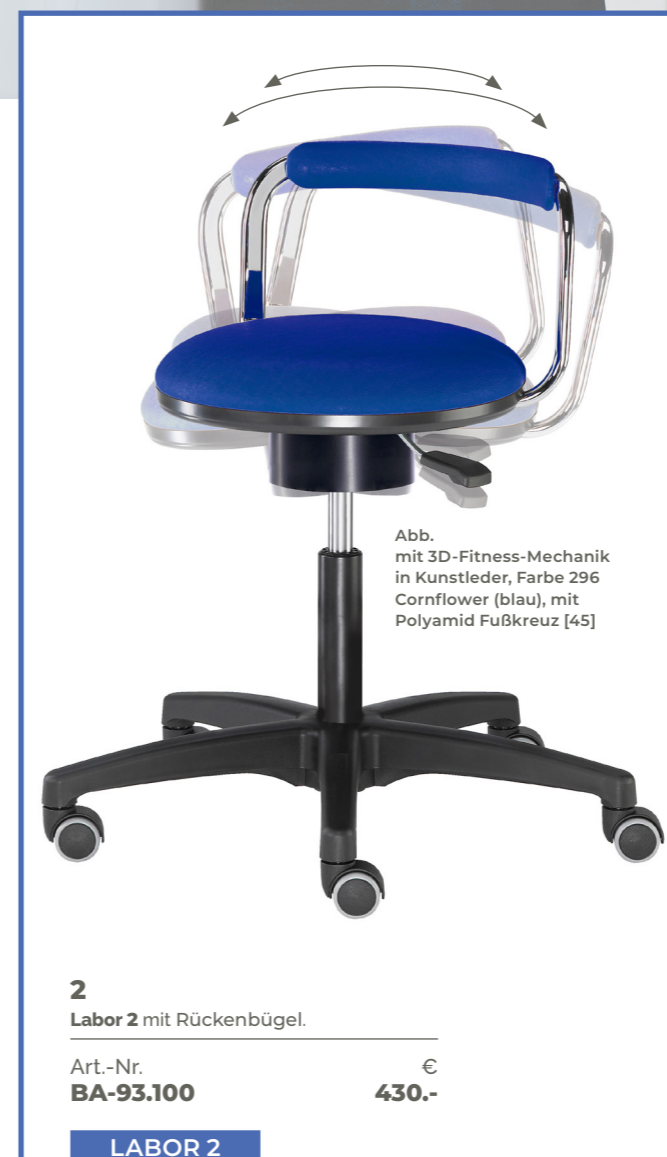
Abb. mit 3D-Fitness-Mechanik in Kunstleder, Farbe 296 Cornflower (blau), mit Polyamid Fußkreuz [45]

2 Labor 2 mit Rückenbügel. Art.-Nr. BA-93.100 € 430.-