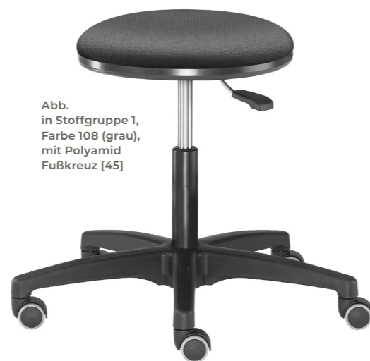
Abb. in Stoffgruppe 1, Farbe 108 (grau), mit Polyamid Fußkreuz [45]

Chromatierter Design-Rückenbügel bei Labor 2+4. Sitzhöhe stufenlos einstellbar. Chromatierter Fußring bei Labor 3+4 zur optimalen Entlastung des Haltungsapparates. 360° Grad Drehung möglich. Entspricht DIN 68877 „Arbeitsdrehstühle“.