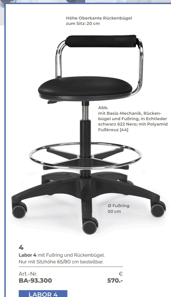
Höhe Oberkante Rückenbügel zum Sitz: 20 cm